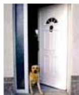
Portes d'entrée PVC